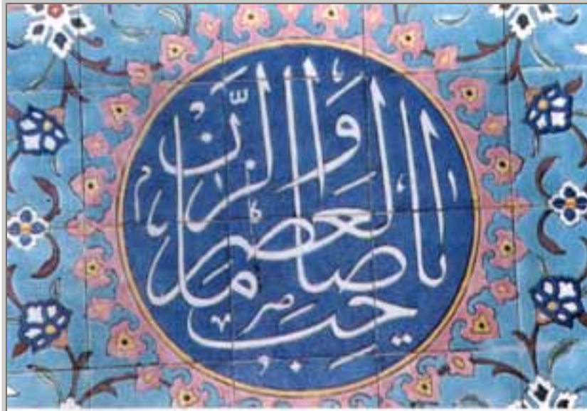
مسجد کے مغربی رواق کے نقاشی کا ایک نمونہ