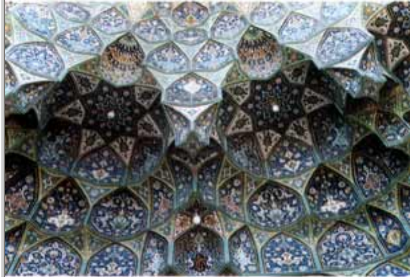
محراب کے رواق کی نقاشیوں کا منظر